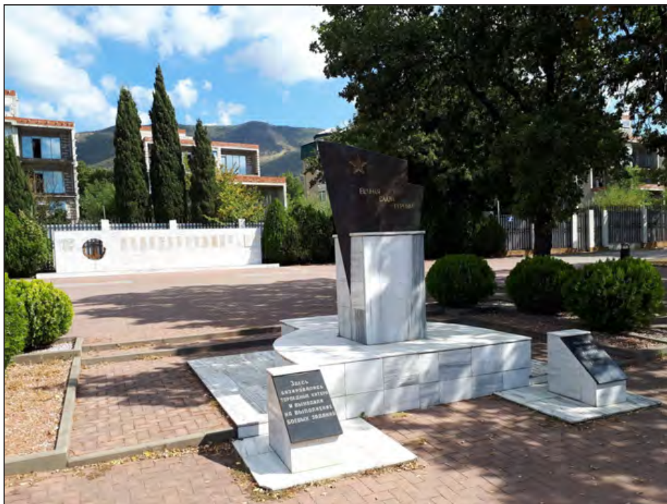
Памятник морякам торпедных катеров, г. Геленджик, 2019 г.