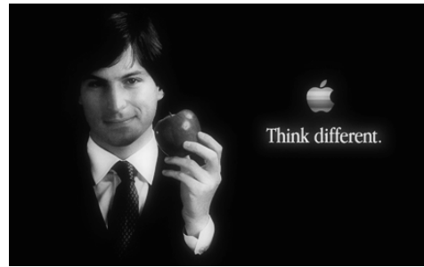
Фото 2. Первая рекламная компания Apple. Стиву Джобсу 29 лет

Узнав о смерти Джобса, толпы американцев приходили к магазинам Apple в различных городах. Люди приносили цветы, зажигали свечи, оставляли открытки с соболезнованиями. В соболезновании, которое