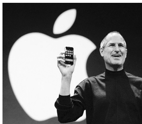
Фото 4. Стив Джобс на сцене Macworld Экспо в Сан-Франциско 11 января 2005 г.

were being spent on my college tuition. After six months, I couldn't see the value in it. I had no idea what I wanted to do with my life and no idea how college was going to help me figure it out. And here I was spending all of the money my parents had saved their entire life. So I decided to drop out and trust that it would all work out OK. It was pretty scary at the time, but looking back it was one of the best decisions I ever made. The minute I dropped out I could stop taking the required classes that didn't interest me, and begin dropping in on the ones that looked interesting.