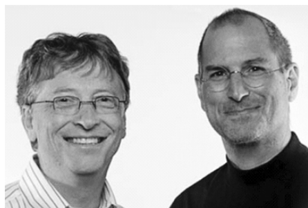
Фото 7. Друзья-конкуренты Стив Джобс и Билл Гейтс на 5-й конференции D: All Things Digital (D5) в 2007 г.

В течение следующих пяти лет я основал компанию NeXT, еще одну компанию, названную Pixar, и влюбился в удивительную женщину, которая стала моей женой. Pixar создал самый первый компьютерный анимационный фильм «История игрушек» и является теперь самой успешной анимационной студией в мире. В ходе поразительных событий Apple купила NeXT, я вернулся в Apple, а технология, разработанная в NeXT, стала сердцем нынешнего возрождения Apple. А Лорен и я стали замечательной семьей.