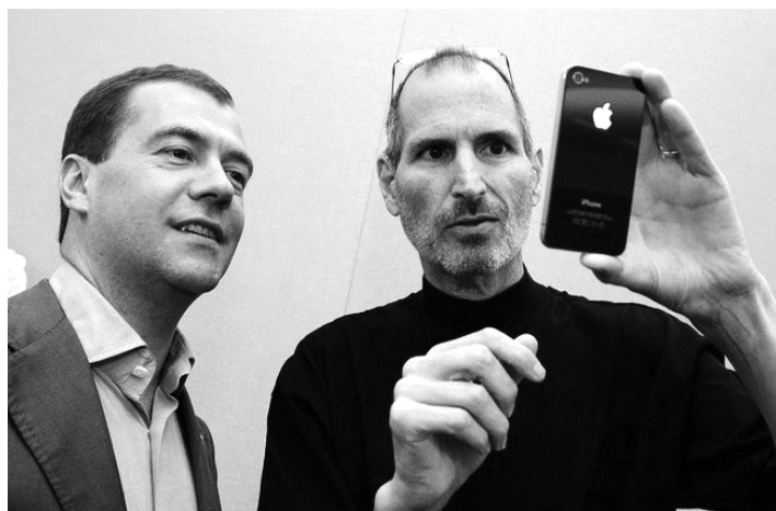
Фото 6. Стив Джобс демонстрирует iPhone президенту России Д. А. Медведеву

Все началось еще до моего рождения. Моя биологическая мать была молодой, незамужней аспиранткой и решила отдать меня на усыновление. Она настаивала на том, чтобы меня усыновили люди с высшим образованием, поэтому мне было суждено быть усыновленным юристом и его женой. Правда, за минуту до того, как я появился на свет, они решили,