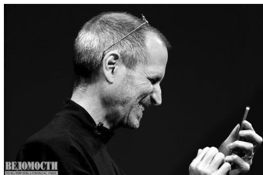
Фото 5. Стив Джобс представляет iPhone 4 на Worldwide Developers Conference в 2010 г.