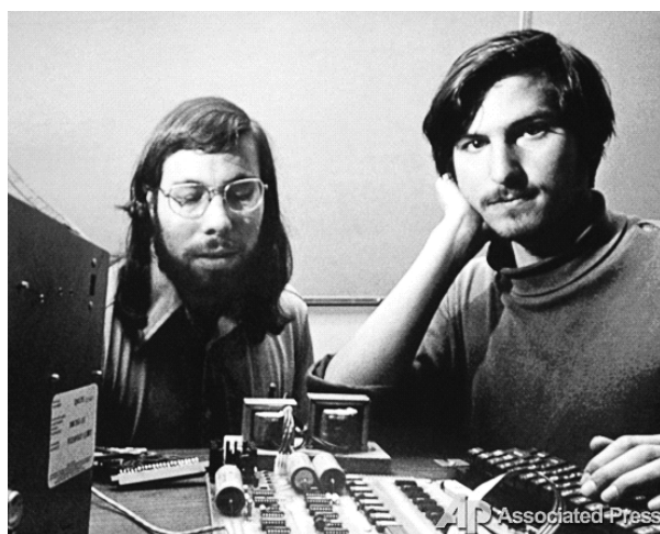
Фото 1. В середине 1970-х гг. Стив Джобс и Стив Возняк создали свой первый персональный компьютер

Стив Джобс родился 24 февраля 1955 г. в Сан-Франциско. Его биологические родители (эмигрант из Сирии Абдулфаттах Джандали и американка Джоан Кэрол Шибле) учились в аспирантуре и были вынуждены отдать ребенка на усыновление Полу и Кларе Джобс.